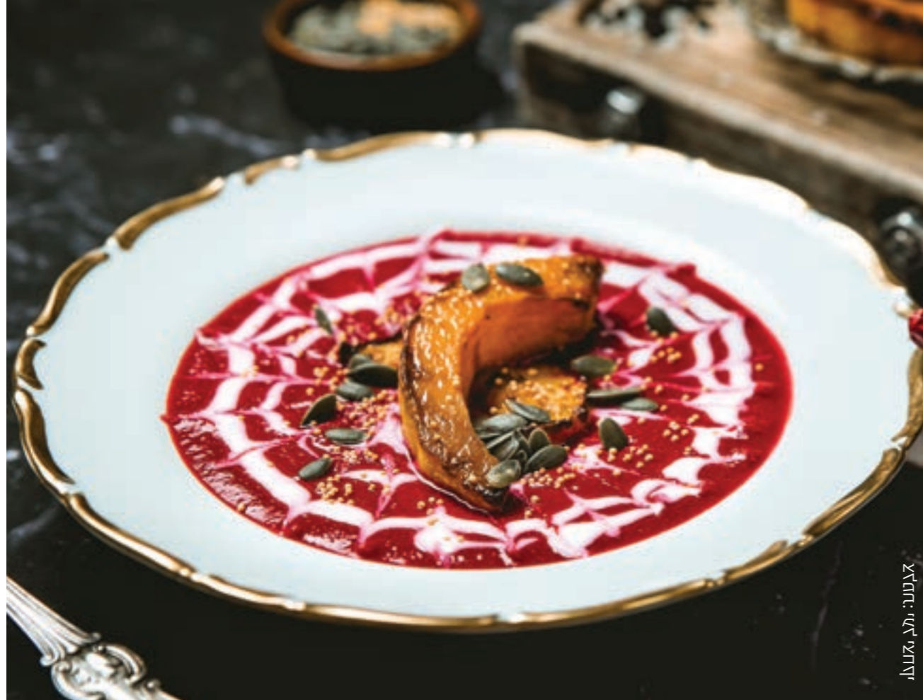
אלמתי יעל יוסף