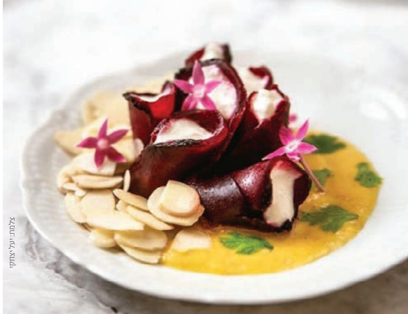
צלמת: יעל יצחקי