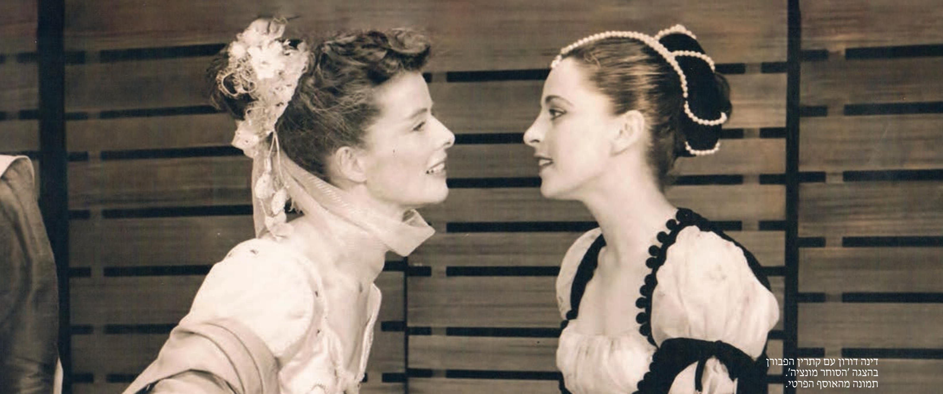
דינה דורון עם קתרין הפבורן בהצגה 'הסוחר מונציה'.

” כשגילמתי את אנה פרנק בברודוויי הרגשתי שיש לי שליחות חשובה, שאני פועלת בשם העם שלי כדי לוודא שהחטא הנורא של השוואה לא יישכח “