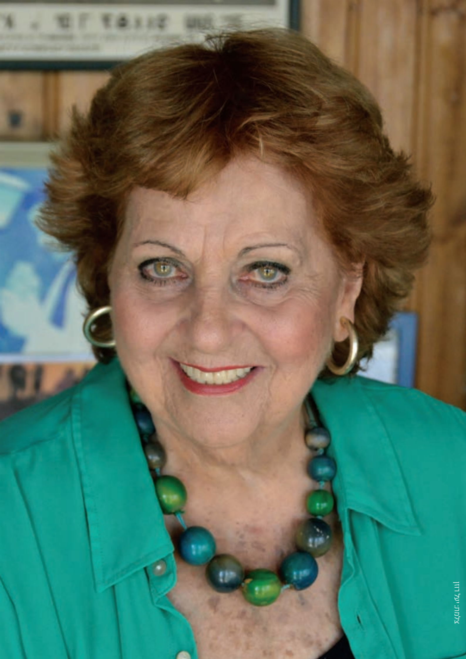
אלמלא: על דודן

”נראה לי שמה שעוזר לנו לשמור על חיוניות והרגשה צעירה וגורם לנו להיות חלק מהחיים העכשוויים הוא יצירת קשר עם צעירים. נסו להיפגש עם צעירים, שלהם אתם יכולים לתרום משהו, אולי מהידע המקצועי שלכם