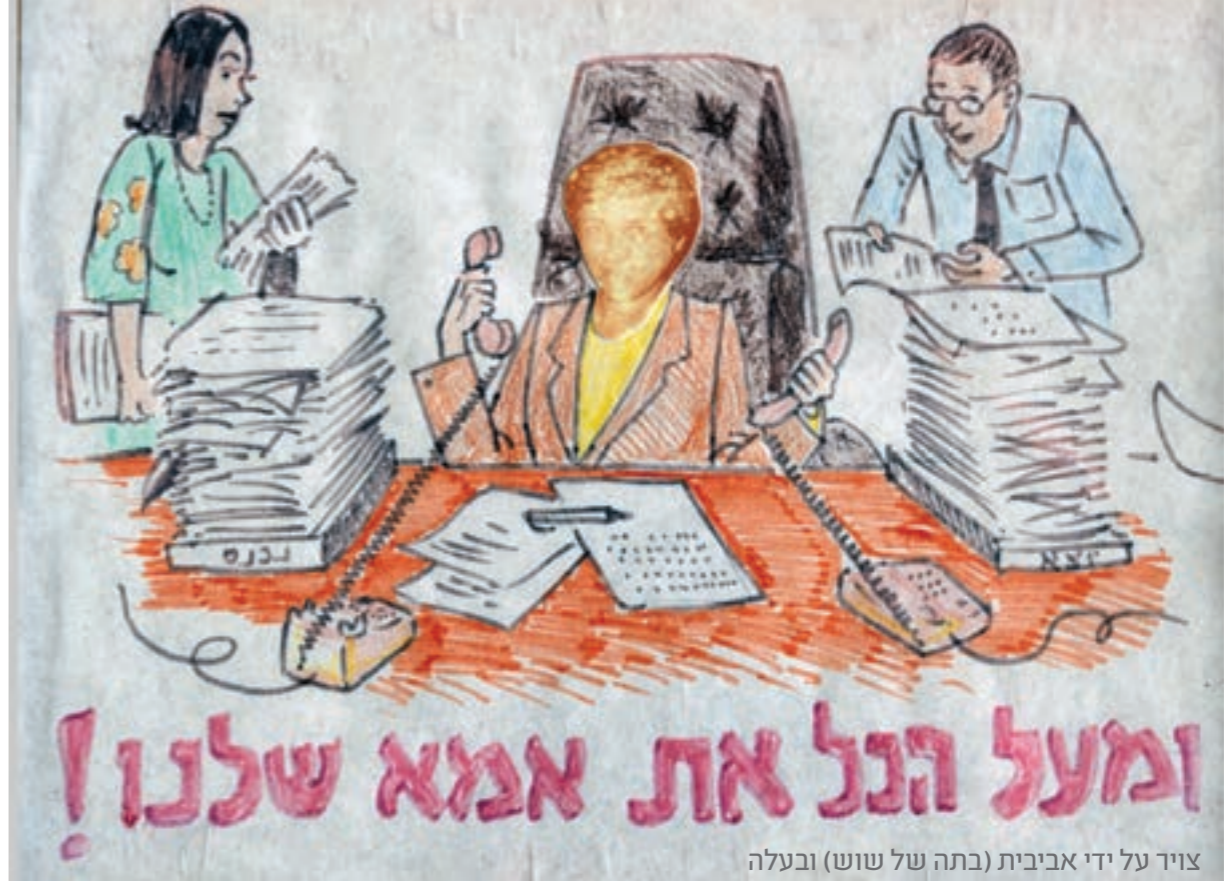
צויד על ידי אביבית (בתה של שוש) ובעלה