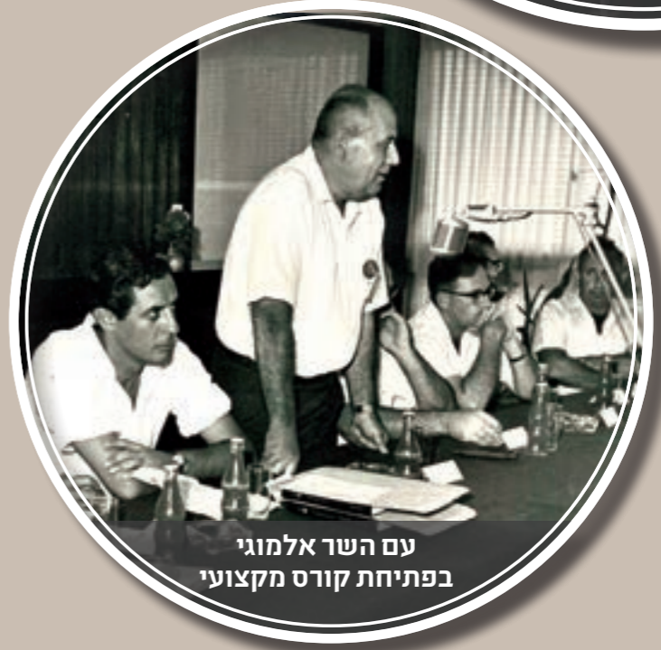
עם השר אלמוגי בפתיחת קורס מקצועי