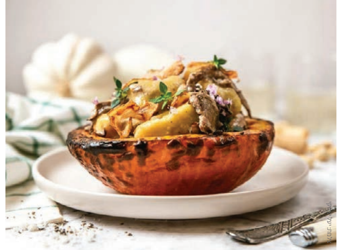
אלמתי יעל יוסף