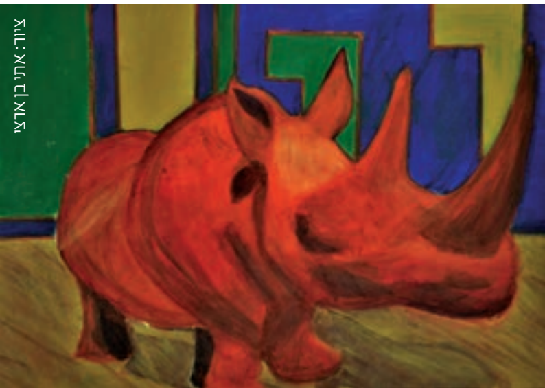
צויר: אתר בן ארצ

מקום של כבוד בבית, אבל אימי לא איפשרה דריסת רגל בממלכה שלה. לאוכל משובח נחשפתי בגיל צעיר, בשעות הרבות ששהיתי במלון המלך דוד, בעבודתו של אבי כמנהל אירועים. שם גם למדתי כיצד לערוך שולחן על פי הכללים, להכין קוקטיילים ולשזור פרחים. אני מבשלת הכול, פעם רבות אני מנסה גם לבשל מנה מוצלחת שאכלתי במסעדה. את סגנון הבישול שלי נוטים לכנות היום פיוז'ן.