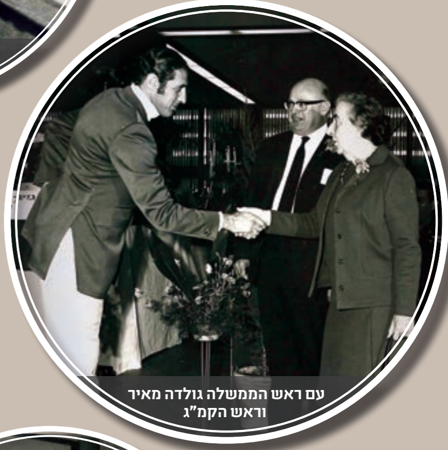
עם ראש הממשלה גולדה מאיר וראש הקמ"ג