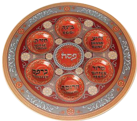
רשת ואהבת צלחת פסח ש 165