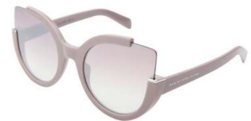
אירוקה מותג MARC JABOBS ש 899