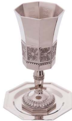
רשת ואהבת גביע קידוש עם רגל וצלחת ש 123