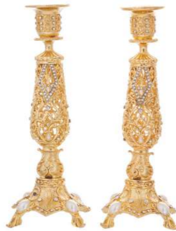
רשת ואהבת זוג פמוטים בזהב משובץ ש 339