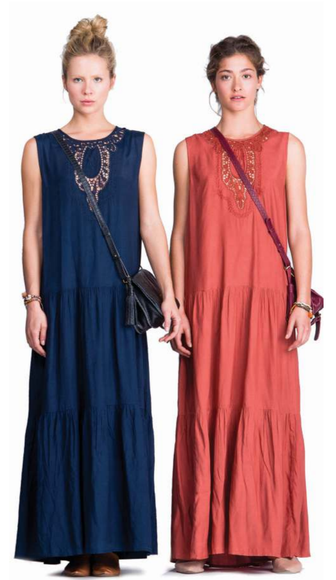
רשת סאקס משיקה אתר מכירות און ליין