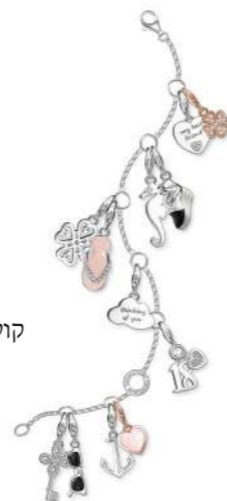
תומס סאבו החל מ-165 ש קולקצית קית 2016