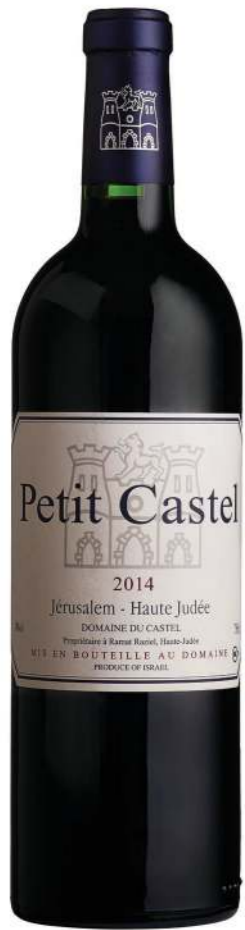
יקב קסטל Petit Castel 2014 ש 123 (Custom)