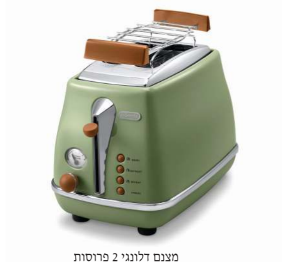
מצנן דלונגי 2 פרוסות ש 449