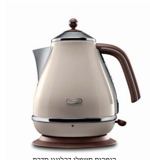
קומקום חשמלי דהלוני סדרת ICONA VINTAGE ש 529